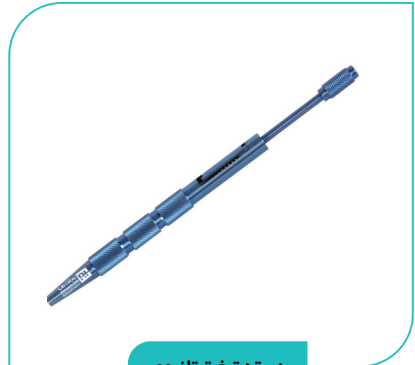
دسته تیغ تیتانیومی