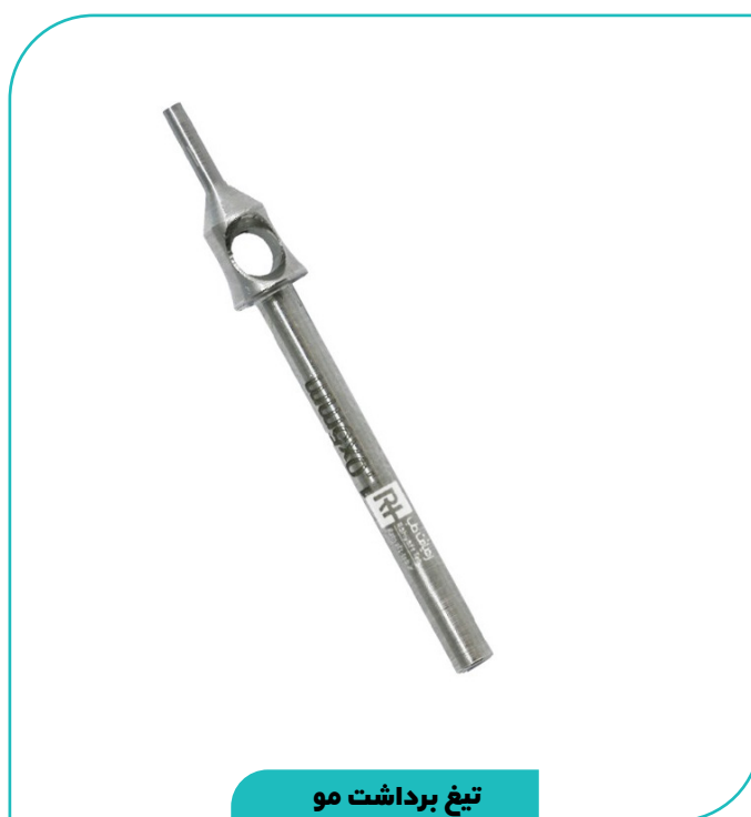
تیغ برداشت مو RTPunch